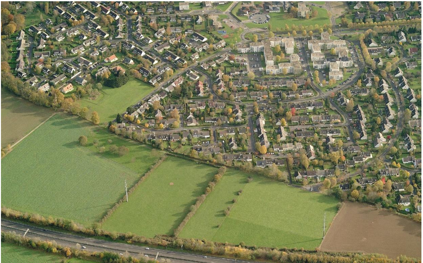
Autre vue sur le chemin de Beauvais et le quartier du Chapitre Pourquoi densifier à l'extrême ce qui l'est déjà alors que la commune voisine possède plein de zones disponibles ?