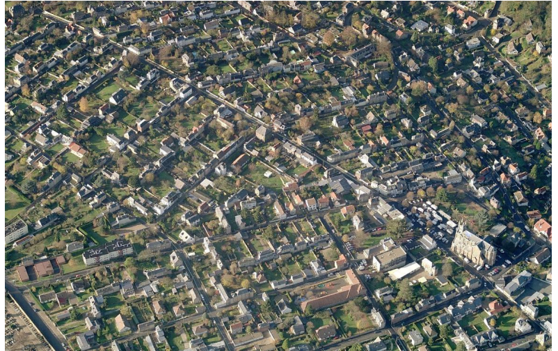
Bihorel historique, pour l'instant sans béton !