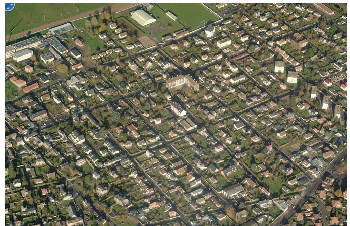
Bihorel, entre Rue de Verdun et Rue Jean Texcier Pour l'instant, les immeubles sont largement minotaires, contrairement à ce que laissent supposer la description du rapport de présentation page 134

Alors que le rapport de présentation lui-même (en p17) , lors de la description de l'existant, déclare